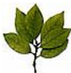
βάγια (φύλλα δάφνης)