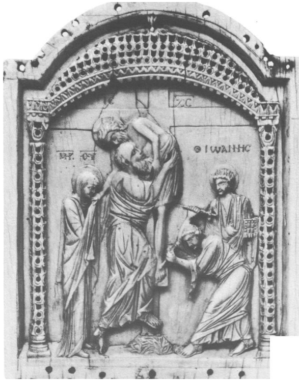
Η Αποκαθήλωση. Μικρή φορητή εικόνα του 10 ου αιώνα, που βρίσκεται στην Ουάσινγκτον.

Οι καμπάνες δεν παύουν να χτυπούν λυπητερά. Μόλις σουρουπώσει, καλούν τους πιστούς για την Ακολουθία του Επιτάφιου Θρήνου. Ψέλνονται τα εγκώμια: το «αι Γενεαί αι πάσαι», το «η Ζωή εν Τάφω» και το «Άξιον εστί». Αμέσως μετά αρχίζει η περιφορά του Επιτάφιου. Μπροστά τα εξαπτέρυγα κι ο Σταυρός – άδειος πια – το κουβούκλιο με τον Επιτάφιο, οι παπάδες και παραπίσω το πλήθος μ' αναμμένες λαμπάδες. Ψέλνουν αποσπάσματα από τα εγκώμια και στα σταυροδρόμια και τις πλατείες σταματούν για να ψάλουν μια δέηση.